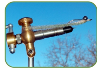
MORSETTO FLYLAB BASE

CONFEZIONE DA 1 PEZZO - PACK SIZE 1 PIECE