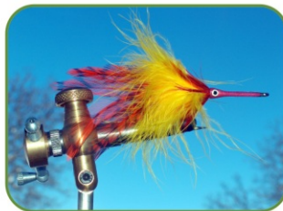
MORSETTO FLYLAB C CLAMP